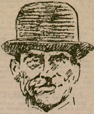
NENTON D. BAKE

altre candidat a la Presidència dels Estats Units. És fill de l'ex-president Theodor, i germà de l'actual governador general de Filipines. Actualment exerceix el govern de Nova York. És protestant i també partidari del lliure consum d'alcohol