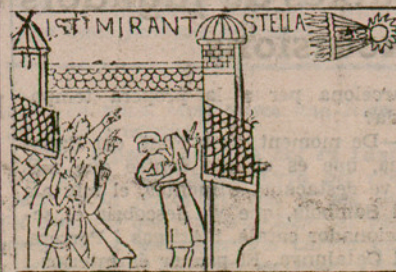
Mirant el cometa d'Halley, en 1066, segons un gravat antic

—iAquest cas s'ha presentat molt sovint? —Molt. En 1858 va aparèixer un cometa que va fer parlar molt. Se'n deia de Donati i era molt semblant, en configuració, al de Coggia, observat en 1784. Els dos passaren de llarg. El de 1843, el de Perrine, i el de Swift, també alarmaren la gent profana. El d'Halley, en la seva sortida de 1835, va motivar rogatives. El de Biela, en 1846, va partir-se en dos, els dos fragments del qual varen ésser vistos no-