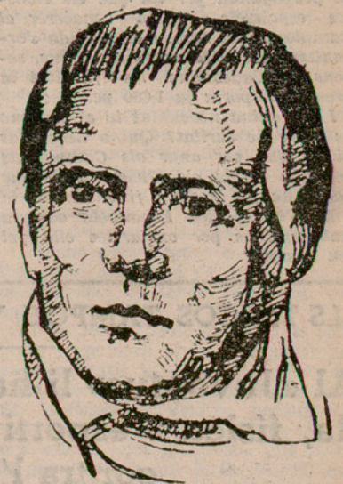
L'insigne novelista WALTER SCOTT, el centenari del qual se celebrarà aviat