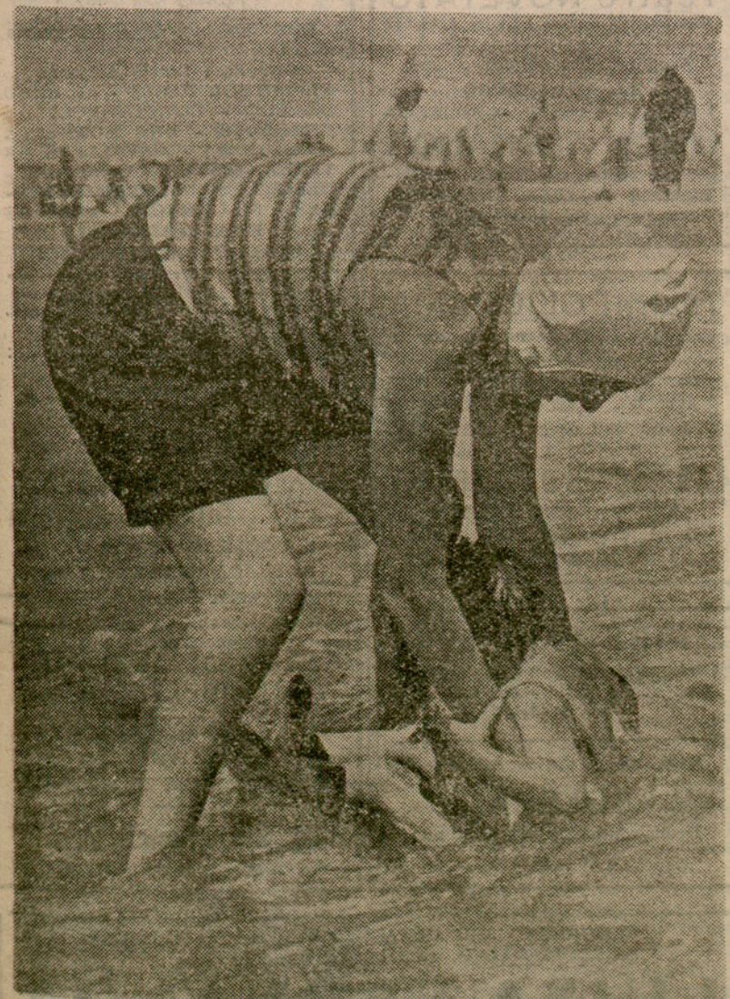
Els banys de mar i la infància. -- Con stitueixen el més bell ornament de les platges en aquests dies d'estiu, els infants que en la sorra i en les oncs troben a l'ensens salut i esbarjo

Griffin es veié obligat a recórrer diverses milles a peu per a obtenir socorsos. Actualment els aviadors han estat traslladats a Minsk, on se'ls presta els socors mèdics necessaris.