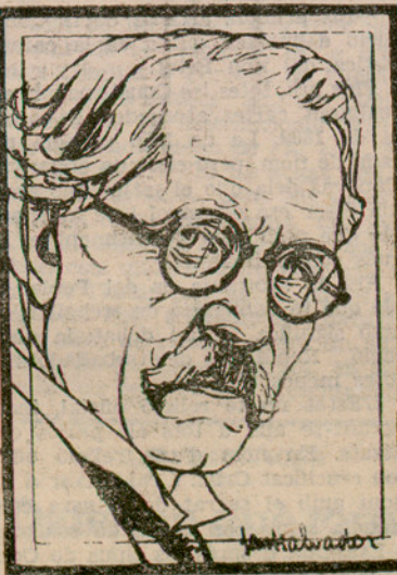
RAMSAY MAC DONALD cap del Govern anglès, que ha tingut participació preferent en els acords de Laussana