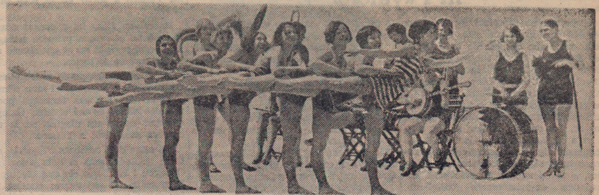
El jazz a la platja... Enguany, les notes estridents de la música bàrbara, sonen a les platges per a divertiment de banyistes. Els seus desacords ritmen, dificultosament amb la suau harmonia de les ones...

Londres. — La ruptura de la barrera glaçada de Shyok, a Cachemira, ha produït la temuda catàstrofe. La inundació és la més desastrosa de totes les que s'han registrat des de 1841. Un exercit de "shiks", que campanya a les vores del riu, ha estat inundat. 40.000 homes han desaparegut.