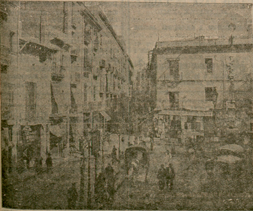
LA PLAÇA DEL PADRO DE TRADICIÓ BARCELONINA

Tot això fa preveure per a demà, a la nit, una festa popular i de gran to vuitcentista que honorarà la Joventut del Centre Republicà Català del districte cinquè i tots els seus organitzadors.