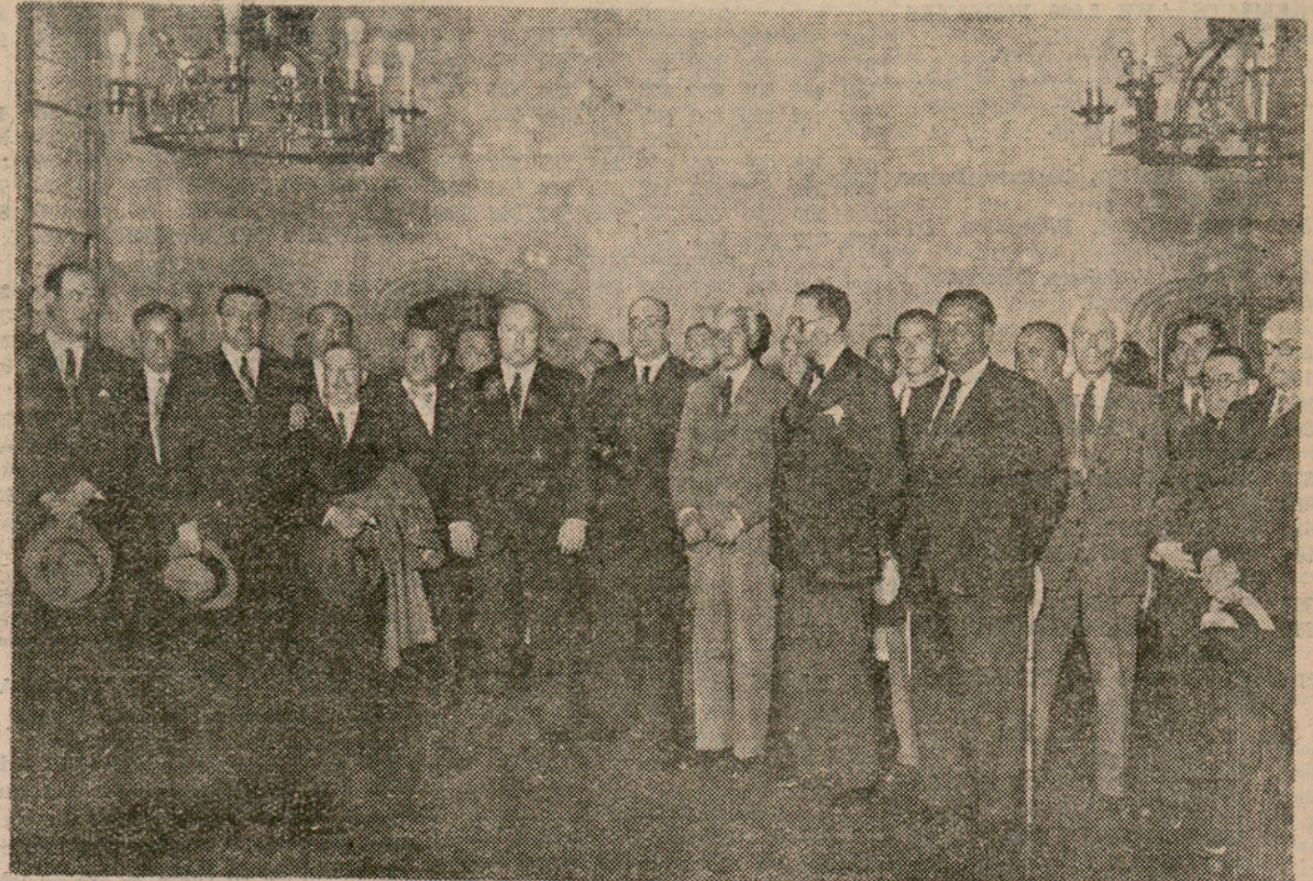
Els diputats gallecs senyors Otero i Castelao, en la seva visita a la Generalitat on foren rebuts pel President Macià

Si en lloc de mantenir impertorbablement la seva voluntat, cedís, no sols es faria mal a si mateixa, sinó que en faria greument a Espanya.»