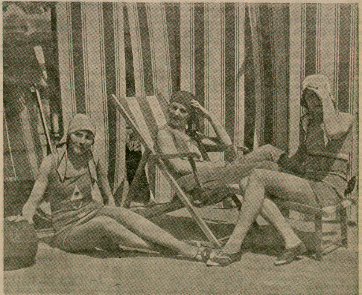
Una escena de platja. --- Abans del bany, una estona de conversa sota les carícies del sol lluminós i l'aire pur

A tot arreu del país es requisaran innombrables automòbils per a conduir les tropes d'Hitler a Berlín, el total de les quals s'eleva a 350.000 homes, i no es veu la manera com podran resistir els socialistes i els republicans a un cop d'Estat preparat d'aquesta manera.