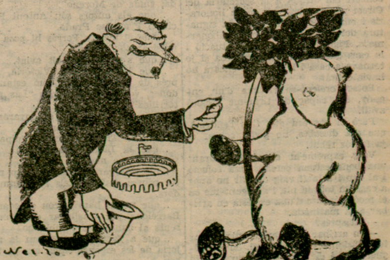
—I el pitjor és que després de la "corrida" el "toro" se'ns ha quedat tan viu com abans.