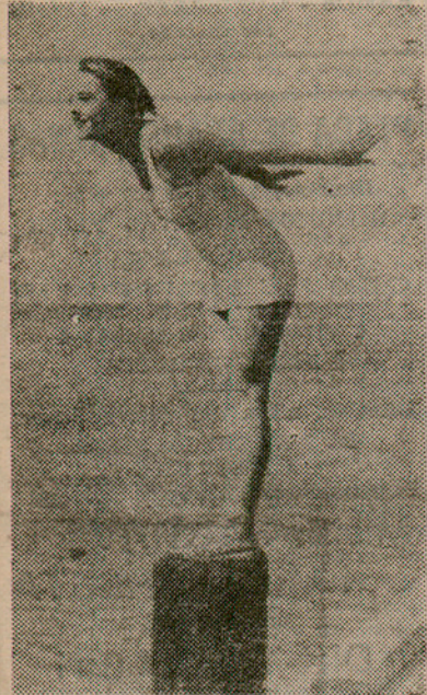
Una gentil banyista, que davant del fotògraf adopta una "pose" a l'ensens esportiva i femenina

El fet que els conreadors del camp aprofitin els primers dies de bonança que es presenten a fi i efecte de salvar la seva collita i la dels propietaris, ha estat degut, en part, a la necessitat de fer-ho imposada per les exigències agrícoles, i en segon lloc, per la promesa feta pública des de tota la