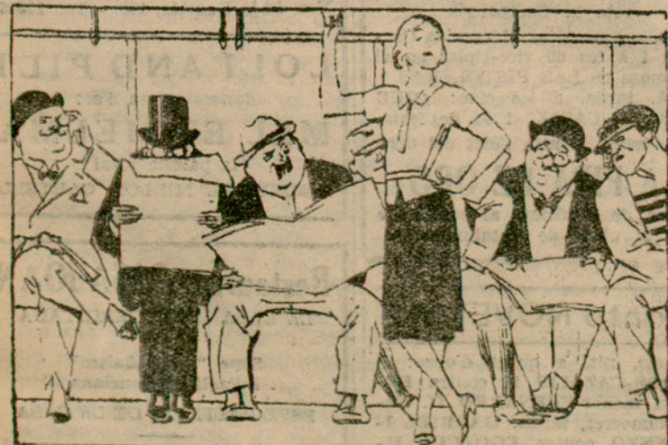
Un punt de coincidència entre tots els partits