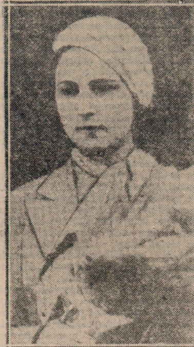
La senyoreta Keriman Ahalie, "Miss Turquia", que a Spa ha estat elegida "Mis Univers"

L'encariment, cada dia major, de les matèries que s'empren en la confecció d'un diari i les repercussions que la crisi econòmica del món tenen fatalment en el negoci editorial, fan que la vida dels diaris sigui avui difícil i penosa, malgrat els esforços i la bona voluntat de les empreses i de tots els elements que en la confecció dels mateixos interverenen.