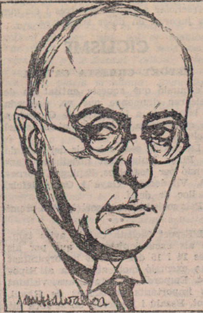
L'ex-canceller BRUNING, qui, en les darreres eleccions d'Alemanya ha obtingut un gran triomf i ha estat elegit a cinc llocs diversos

Acaba el document afirmant que els Sindicats no retrocediran ni claudicaran en la lluita ni en els seus principis, encara que hagin de raure en la clandestinitat.