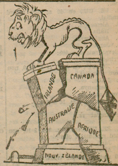
EL LLEO BRITANIC Un sócol que frontolla

Ara no ho fan perquè estan convençuts que amb el senyor Azaña no es juga.