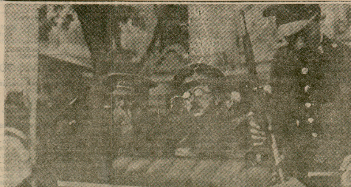
Els caps de la sublevació, conduïts en automòbil a la Direcció General de Seguretat

Ahir tan bon punt l'alcalde accidental senyor Pere Comas rebé les primeres noves de la fracassada sublevació militar, expedí al senyor President del Consell de Ministres, senyor Azaña un telegrama que deia: "L'alcalde de Barcelona manifesta una vegada més la incondicional i ferma adhesió Govern de la República i Ajuntament acordarà aquesta mateixa tarda infrangible fe règim. Signat, Comas, alcalde accidental."