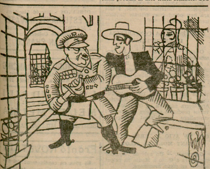
EL "GUERRERO" DE SEVILLA

"Hay un membrete que dice: "Gobierno Civil de la provincia de Sevilla. Secretaria. — Negociado número..." — Tan pronto reciba usted la presente comunicación se servirá hacerse cargo del Ayuntamiento de esa ciudad, procediendo al arqueo de caja e incautación de los libros y archivos, practicando, si fuera necesario, la detención de los que se opusieran a estas medidas. También procederá a la clausura de los Centros Obreros, efectuando las detenciones que a su juicio y buen celo estimare necesarias. A todos los indicados efectos, este Gobierno Civil confiere a usted las más amplias atribuciones, esperando se sirva darme cuenta del cumplimiento de lo ordenado. — Sevilla, 10 de agosto de 1932. — El gobernador (firma ilegible). Rubricado. — Señor capitán de la Guardia civil de..." Després d'això ningú no dubtarà que el general Sanjurjo sols volia salvar la República.