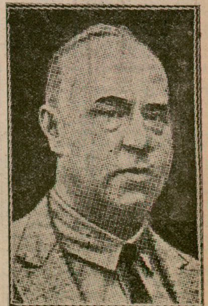
La direcció del partit nacional-socialista alemany sembla que passarà a mans de Gregor Strasse, el retrat del qual publiquem. L'itler, deprimat pels darrers fets polítics, ingressa a un sanatori de Baviera

El president de la Generalitat desitja que aquest viatge de les personalitats de la República a Barcelona resulti triomfal i com d'adhesió de Catalunya a la República espanyola.