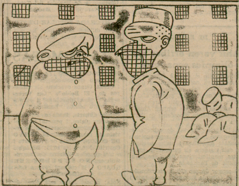
Quina llàstima que no torni la monarquia. Amb les relacions que ens estem fent ara.