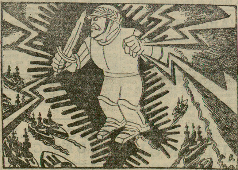
LA LOGICA DE MUSSOLINI

A totes les dependències de la casa, a la capella i al jardí es practicà un minuciós registre. Naturalment, Barrera no fou trobat. Tampoc no es trobaren armes ni documents.