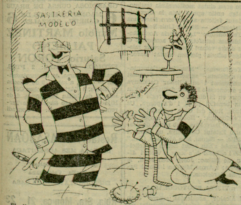
El client. -- Què li sembla? Em va bé? El sastre. -- Ja ho crec. Sembla i almen un príncep!