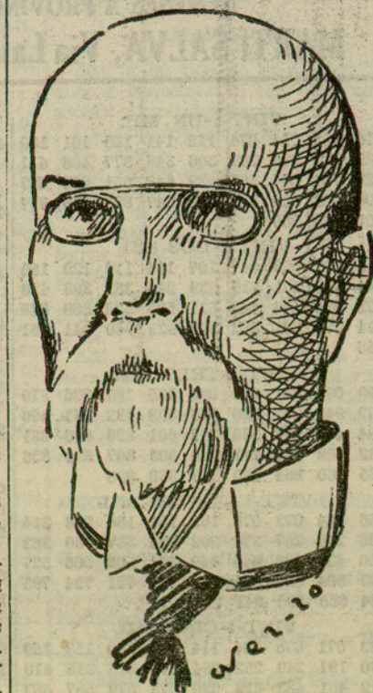
El president Masaryk

—Bé, sí. Però ja ho explicarà ell. I quan hagi explicat això tan confós, ho veurem clar. Ell ho explica tot tan senzillament!