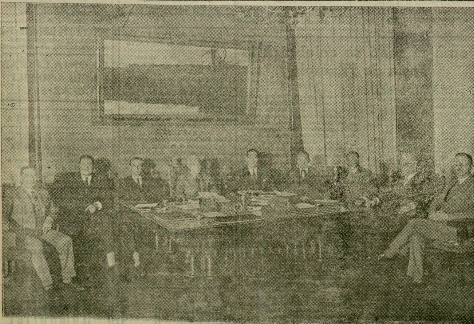
El nou Consell de la Generalitat de Catalunya, el qual va prendre possessió en la sessió d'ahir, sota la presidència de Francesc Macià

Atenes. — M. Tsaldaris, cap del partit popular (monàrquic), s'ha dirigit a M. Zaimis, president de la República, amb una lletra d'adhesió al règim. M. Zaimis ha publicat un manifest al poble, al qual anuncia que el partit popular, reconeix la república i que des d'aquest moment, la lluita per qüestions de règim no existeix més.