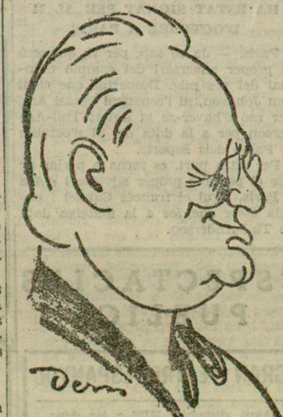
EL delegat de la U. R. S. S. a Ginebra, senyor Litvinof

Ginebra. — A mesura que passen les hores sense saber-se res de la misteriosa desaparició del Comissari del Po-