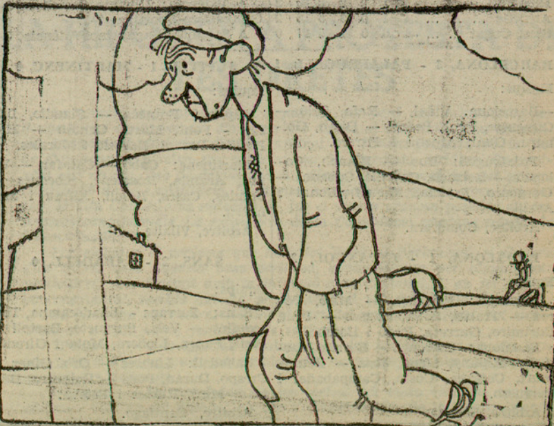
—El que jo pagaria perquè l'impost sobre la renda em semblés un abús!