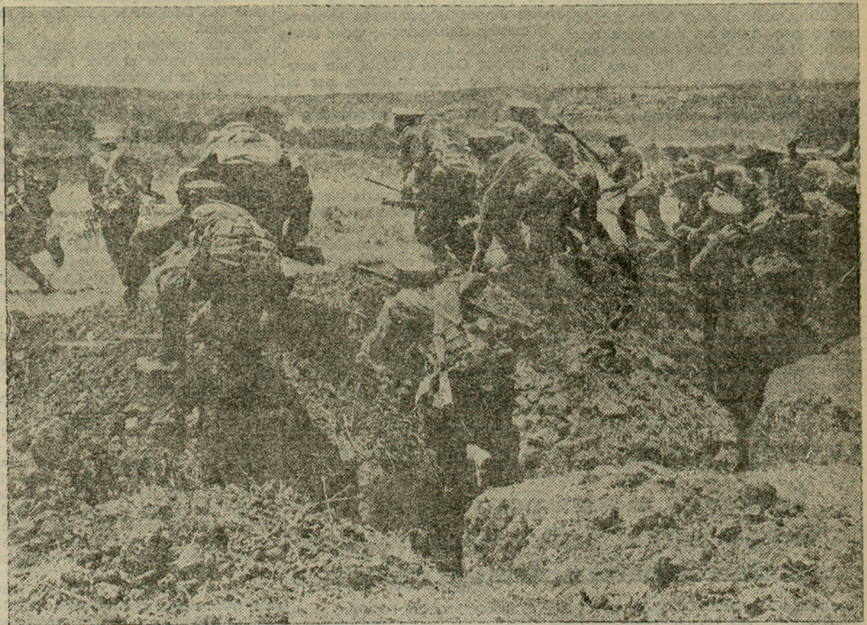
DEL CONFLICTE DEL "CHACO" La infanteria paraguana en el moment d'abandonar les seves trinxeres per a assaltar les posicions enemigues