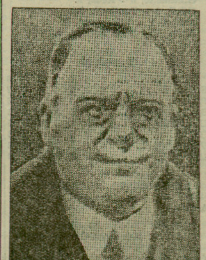
M. de Broqueville, nou cap del Govern de Bèlgica