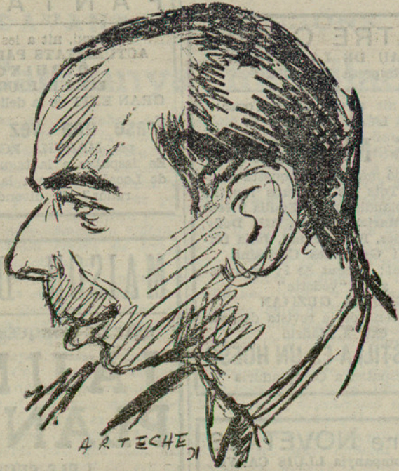
A. R. T. ECHE

canceller del Reich, fa tots els estoccos, davant les eleccions que s'apropen, per a demostrar que no hi ha perill de restauració monàrquica a Alemanya. Sembla, però, que ningú se'l crea