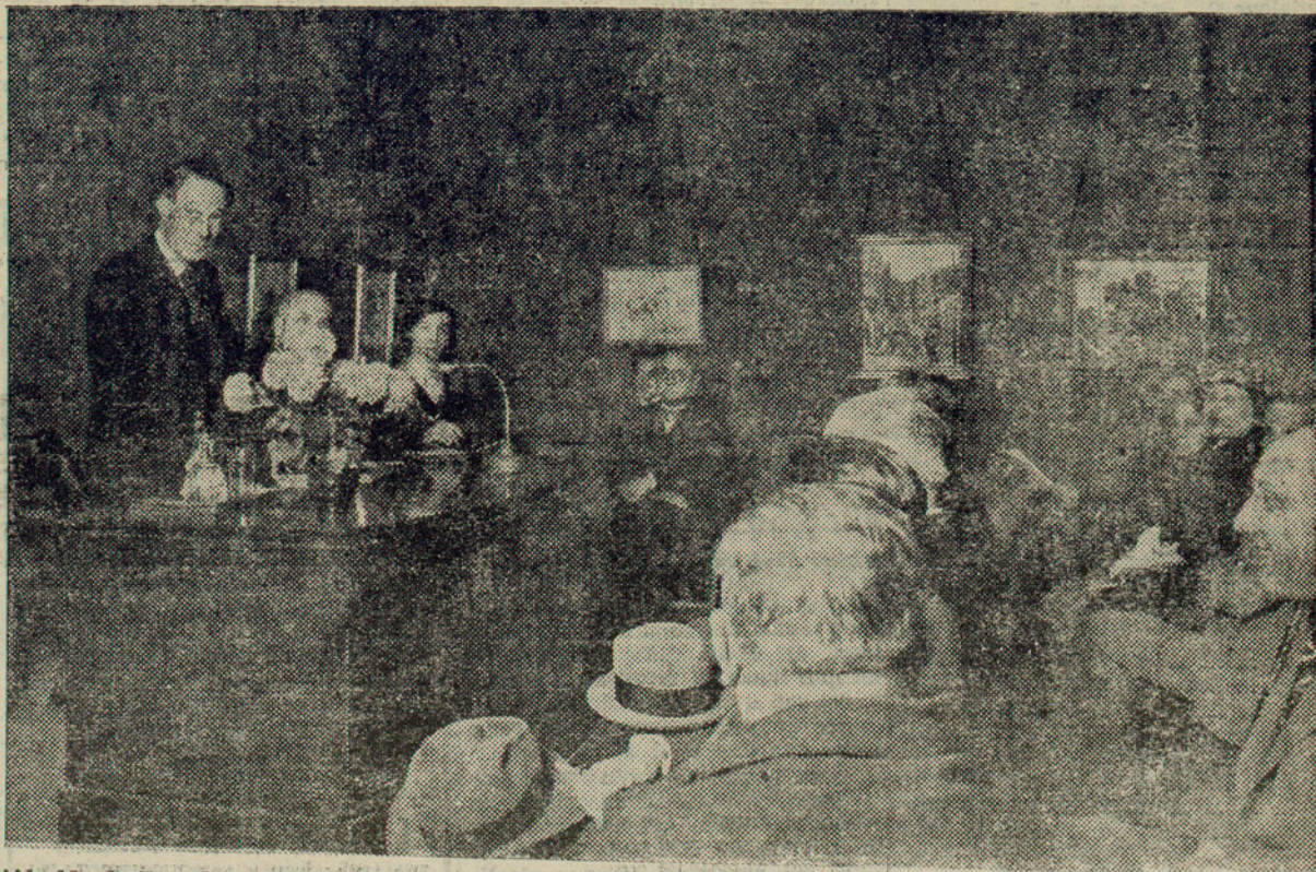
L'Alcalde de Barcelona, doctor Aiguader, en la conferència que donà el dissabte sobre "El llibre científic català"

En el moment polític que es considerés esgotada aquesta continuïtat, el país tindria de dir si debia continuar el rumb vers l'esquerra, adhuc penetrant en les realitzacions socialistes, o si era prudent establir l'obra aconseguida, encarregant-se del Poder elements republicans més moderats."