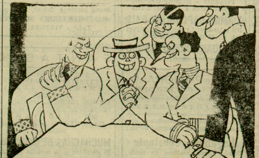
—Ja ho saps que els agracis no vindran a la sessió el dia dels Morts? —Naturalment. Bé teneu que celebrar la seva festa!

S'ha disposat que vagi al lloc del succés una brigada de bombers per tal de fer determinats reconeixements en un pou que existeix prop de la finca on ha passat el drama, si bé fins ara, per la rapidesa amb que hem de facilitar aquestes notícies, no podem concretar l'objecte d'aquesta diligència, per bé que no fóra estrany que aquesta tingués la finalitat de tractar de trobar l'arma amb la qual s'han causat les ferides a la víctima.