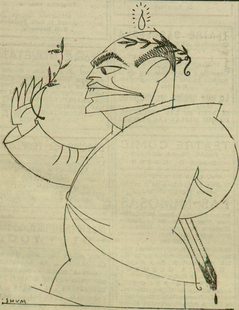
Mussolini: — Pau, germans, pau.

S'han practicat 21 detencions d'obrers que coaccionaven els que entraven al treball.