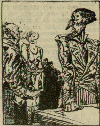
—Ens hem unit per a no pagar-te. I et convidem a ésser dels nostres. (De "Kladderatsch", de Berlín)

Al voltant del president ha estat organitzat el servei ràdiofònic de la policia secreta, en vistes a una mobilització important de forces de policia.