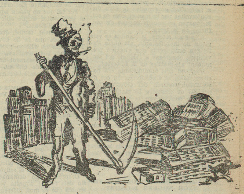
Als Estats Units no passa setmana sense que es declari en fallida, quan menys quinze banquers

Durant la Dictadura tampoc ningú no el va veure.