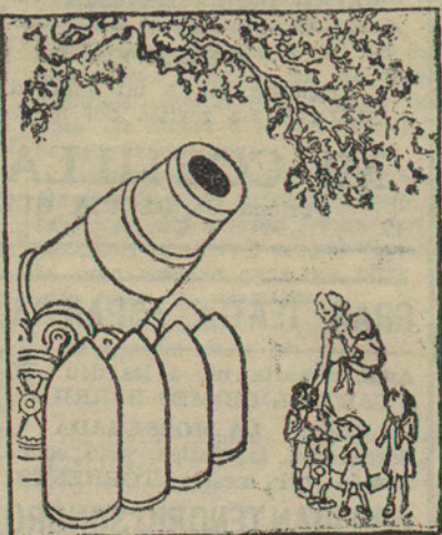
LES DUES FAMILIES —Mireu, mire... Que ben alimentats que estan aquests! (De "Nebelpatter", Suïssa.)

Molts dels diputats que varen fer oposició a l'Estatut i que no el varen voler votar, són ara per Barcelona dient que sense ells no s'hauria aprovat l'Estatut.