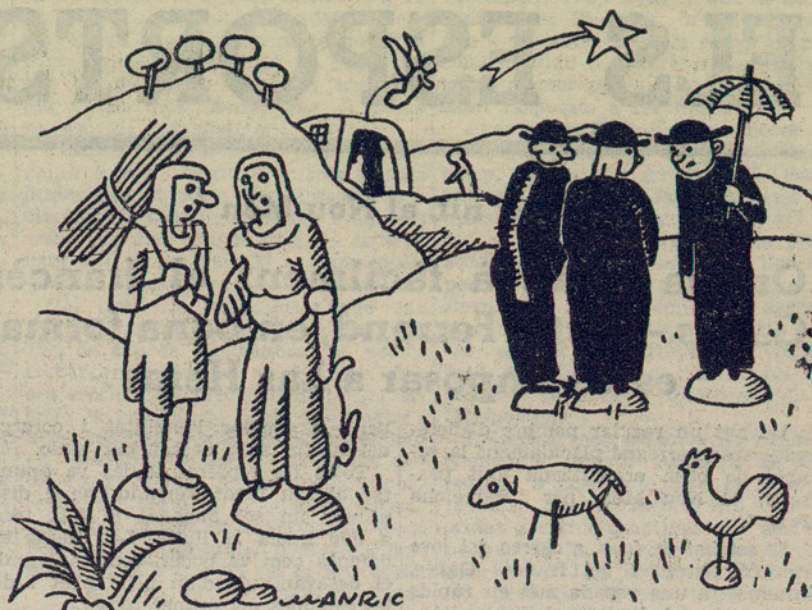
El pessebre d'enguany. — Figures que han passat de moda

S'ocupà de la tasca de la República, realitzada i per realitzar, assegurant que perquè el nou règim subsisteixi, l'orientació de la República ha d'ésser completament esquerrana, radical i revolucionària.