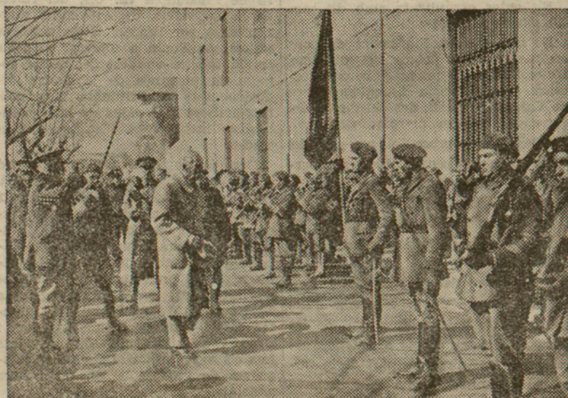
DEL VIATGE DEL PRESIDENT DE LA GENERALITAT A GIRONA. El senyor Macià revisant les tropes que li reteren honors en arribar a Girona

immediata. Per ara no se'ls veu més programa que el d'enderrocar a aquest Govern. Què van a fer després per a calmar les ansies que hi ha als pobles espanyols?