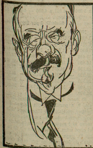
Huître polític socialista belga senyor Vanderveide, el qual, acompanyat de la seva esposa, arribà ahir a Madrid

«Nadie ya, ni individuos ni colectividades deben adoptar iniciativas, pues estas corresponden a la Federación Local de las Sociedades Obreras, cuyo Congreso le dió amplio mandato y abundantes medios para actuar. Rogamos a todos que den por terminadas las protestas contra la agresión y la actitud provocadora de los elementos derechistas. Si éstos insistieran las instrucciones no se harían esperar.»