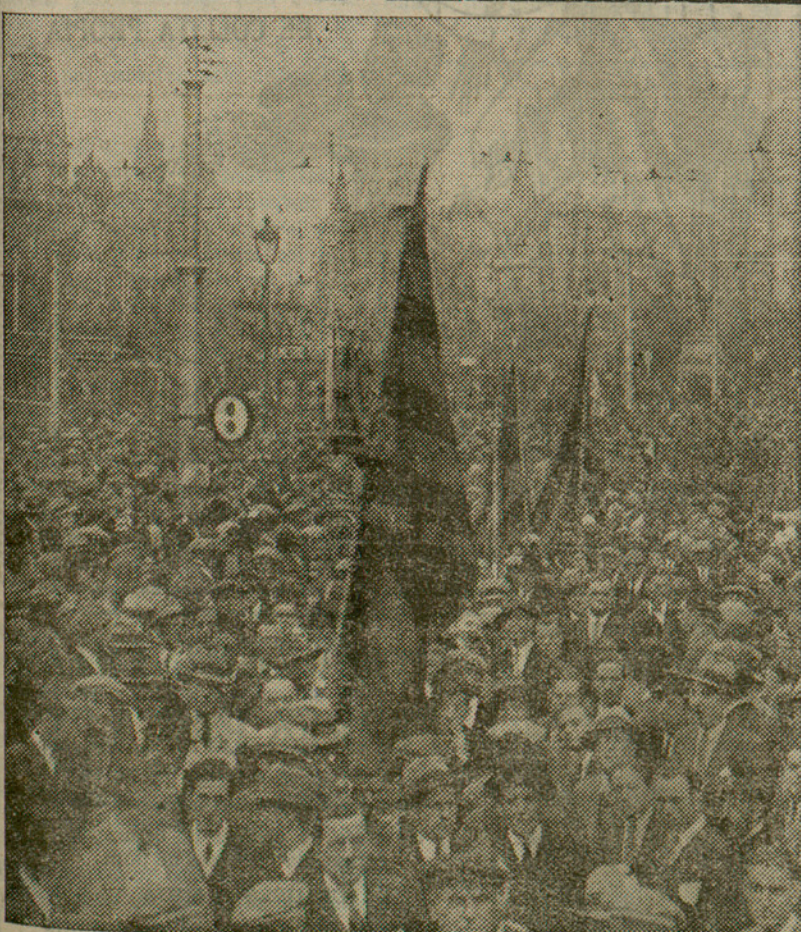
La manifestació cívica en passar per la Plaça de Catalunya

I AIXO VA OCORRER AHIR, SEGON ANIVERSARI DE LA REPUBLICA LAICA...!