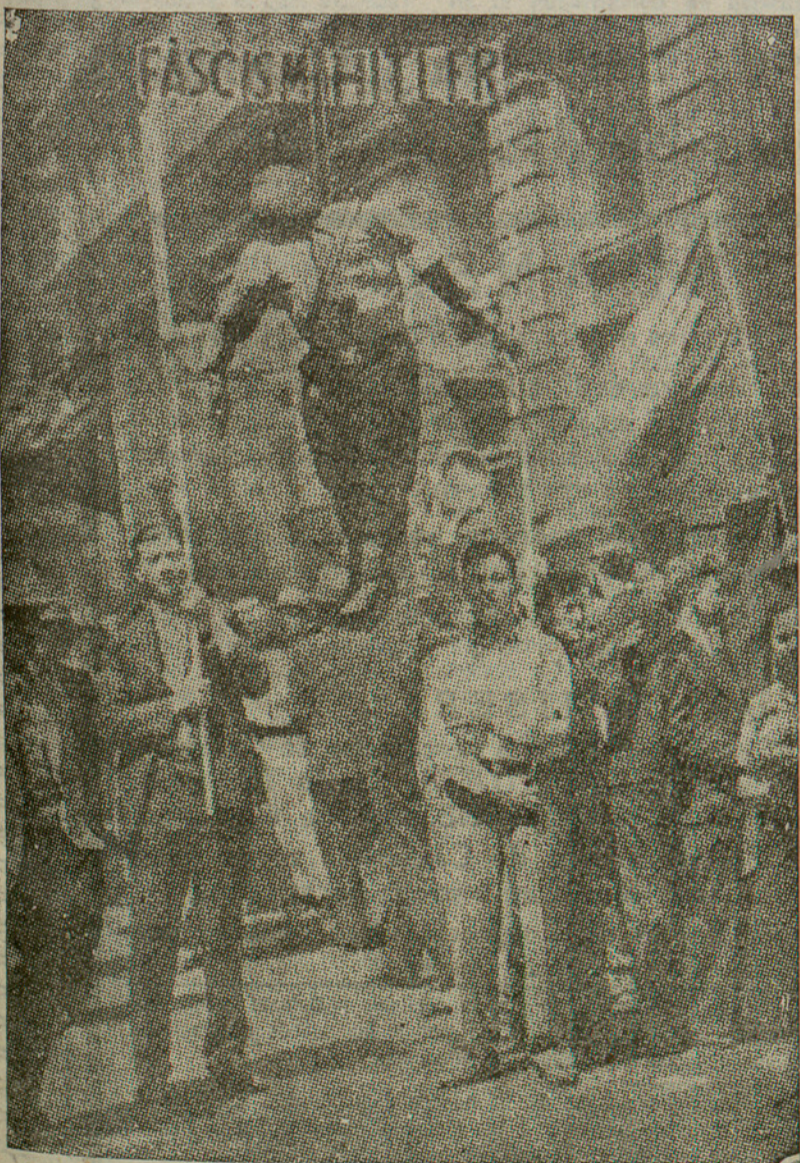
Els membres del partit socialista de Nova-York, en nombre de 15.000, desfilaran el Primer de Maig passejant, ostensiblement, una efígie grotesca del dictador d'Alemanya