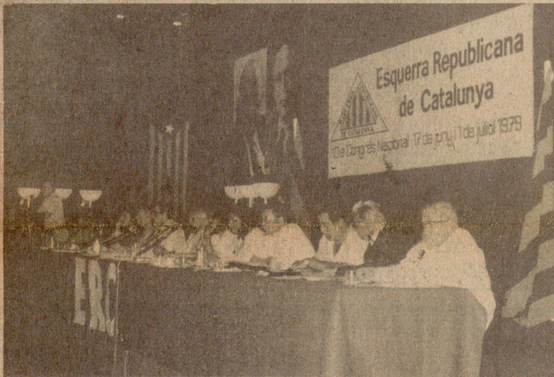
La presidència del Congrés amb panoràmica