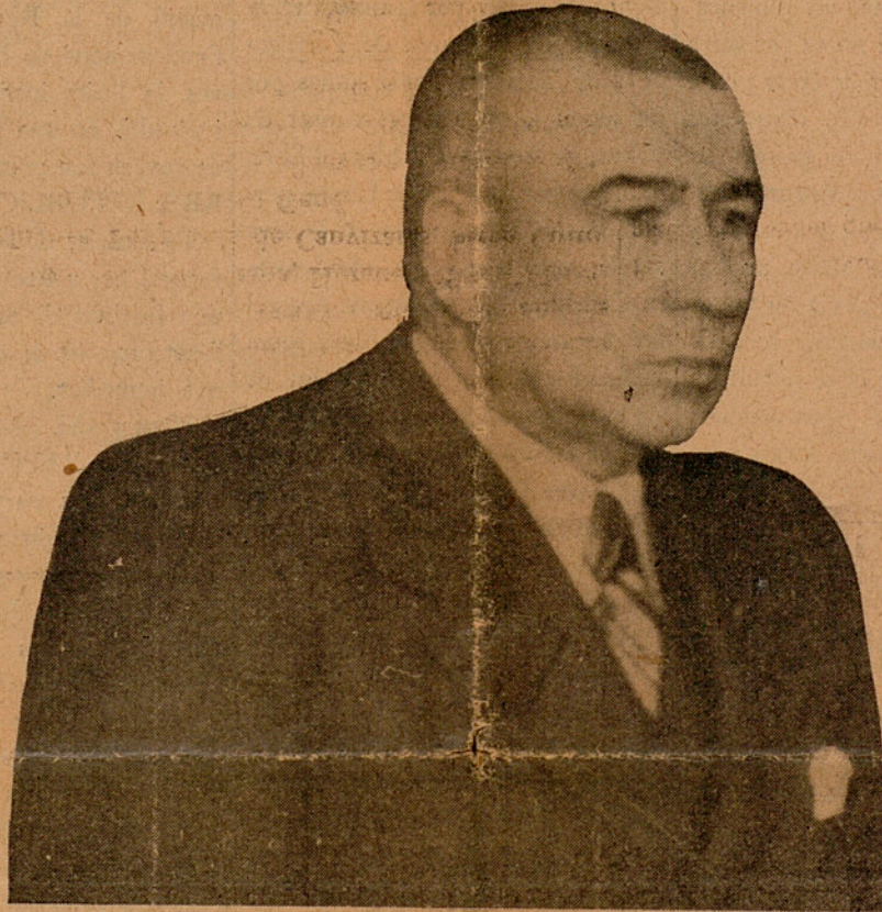
Sr. JOSEP IRLA

(D'un autògraf del President Companys datat a l'exili.)