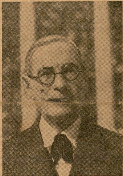
Nota del Senyor Rovira i Virgili

Al cap d'alguns mesos de consultes i converses, ha quedat constituït el Consell Assessor de la Presidència de la Generalitat, el qual començarà a actuar dintre de pocs dies. Si les gestions han estat llargues, el resultat obtingut és satisfactori. L'essencial, en aquest cas, no era fer les coses de pressa, sinó fer-les bé. Calia donar al Consell el valor tècnic de les persones designades i alhora el gran valor moral d'una col·laboració estreta entre homes pertanyents a diverses tendències nacionals, segons l'orientació senyalada pel President Irla en el seu missatge al poble català.