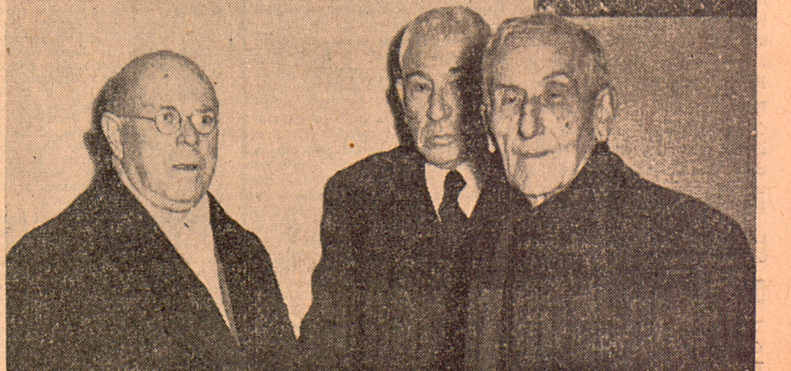
EL PRESIDENT IRLA AMB ELS MESTRES FABRA I CASALS POC DESPRES DEL LLIUAMENT DE LA MEDALLA.

L'ADHESIO D'EUSKADI El President del Govern d'Euzkadi, Sr. José A. Aguirre trameté el següent telegrama a Mestre Pompeu Fabra: « Rebi nostra cordial salutació en merescut homenatge i amb ella l'adhesió del Govern basco i de tots els bascos que admiren amb catalans el mestre, el patriota i el democrata. José A. Aguirre ». El President de la Generalitat representa el President d'Euzkadi en els actes d'homenatge.