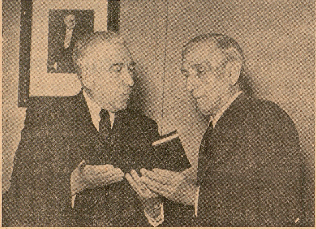
EL MOMENT EMOCIONANT EN QUÈ EL PRESIDENT IRLA LLIURA LA MEDALLA AL MESTRE FABRA.