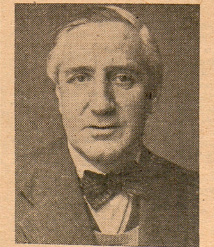
CARLES PI I SUNYER

Val a dir que no han estat únicament els catalans els qui, ací, han donat importància a aquesta visita. La premsa — la gran premsa — mexicana informà els seus lectors de l'arribada del senyor Pi i Sunyer i ha anat donant compte dels actes en els quals ha pres part. D'aquests fou el de portar una corona, amb l'escut de Catalunya, al monument commemoratiu de la independència de Mèxic, una columna que simbolitza la llibertat precisament.