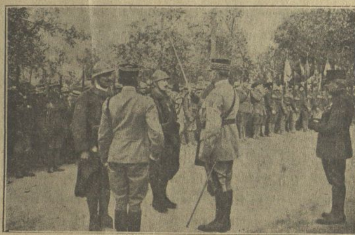
En Jofre condecorant als heroics voluntaris catalans

Barcelona, que quand la onada alemanya sobre Verdun, envia sos més cèlebres oradors i sos més eminents ciutadans per a propagar sa fe en nostre victòria. Un dels seus més cèlebres poetes digué també "no passarán", i no han passat. Dels 12 mil voluntaris catalans no quedaven l'últim any més que 2,000. França no deu oblidar aixó, ni ho oblidará."