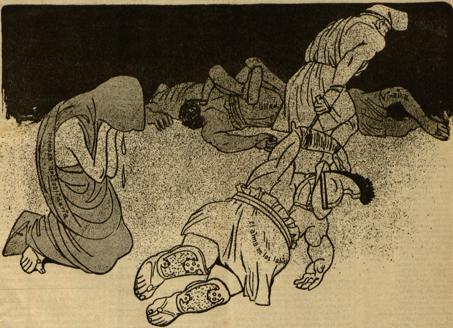
El Catalá: — Au, al canyet!!