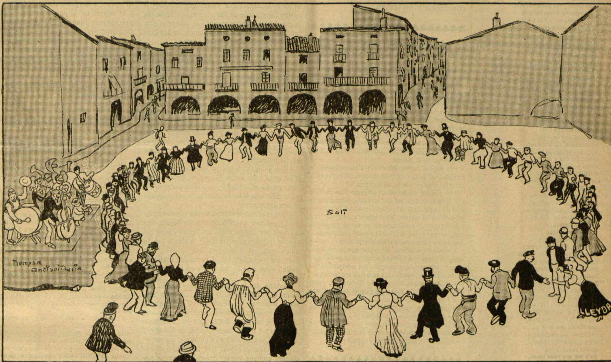
¡Y que vagin sonant els músichs!