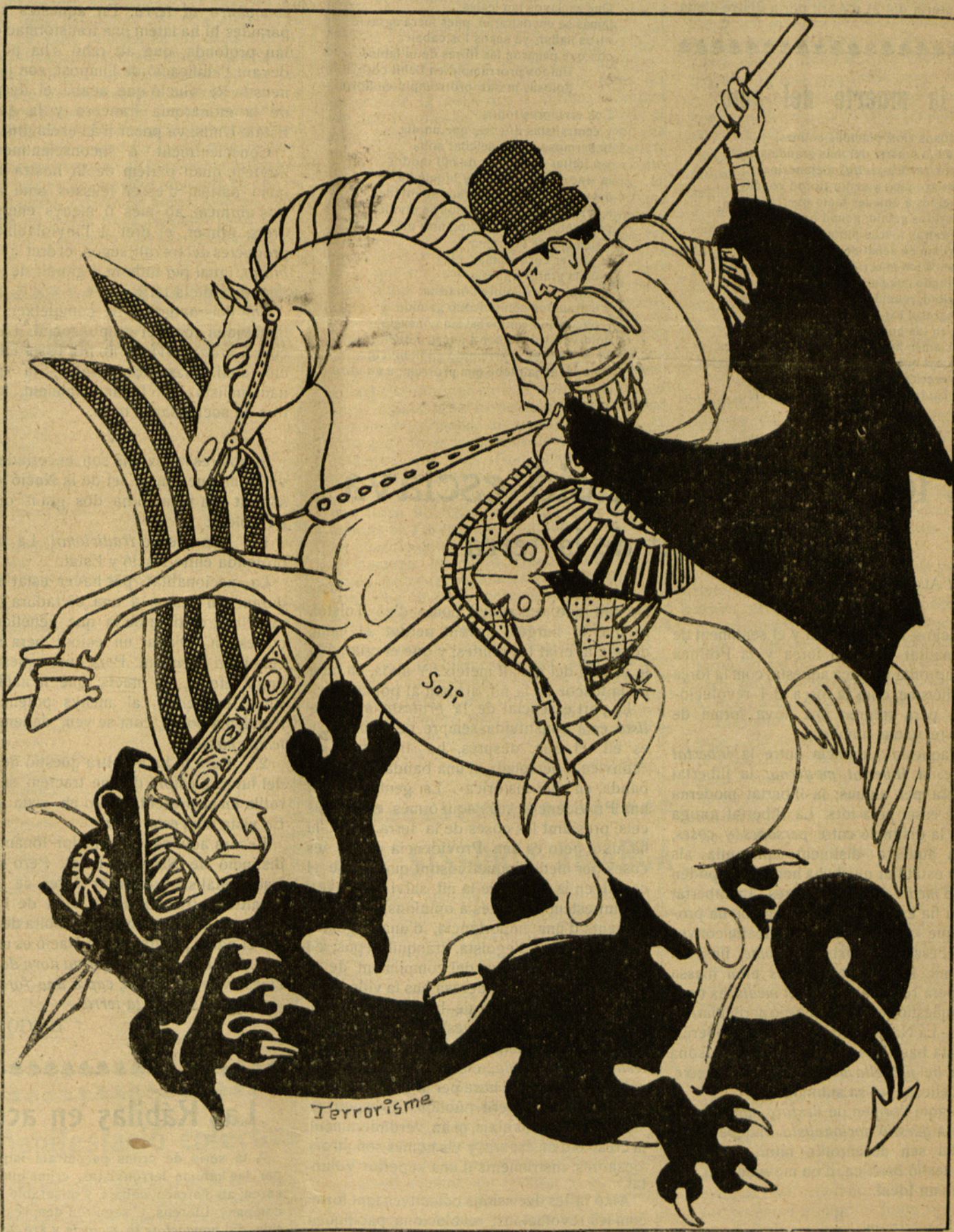
Sant Jordi mata l'aranya