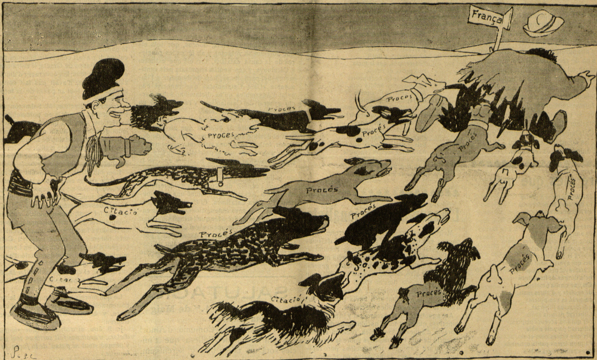
Lo Metralloyre:— Ep... Lacandro, escolta: ¿que vas á preparar la revolució?