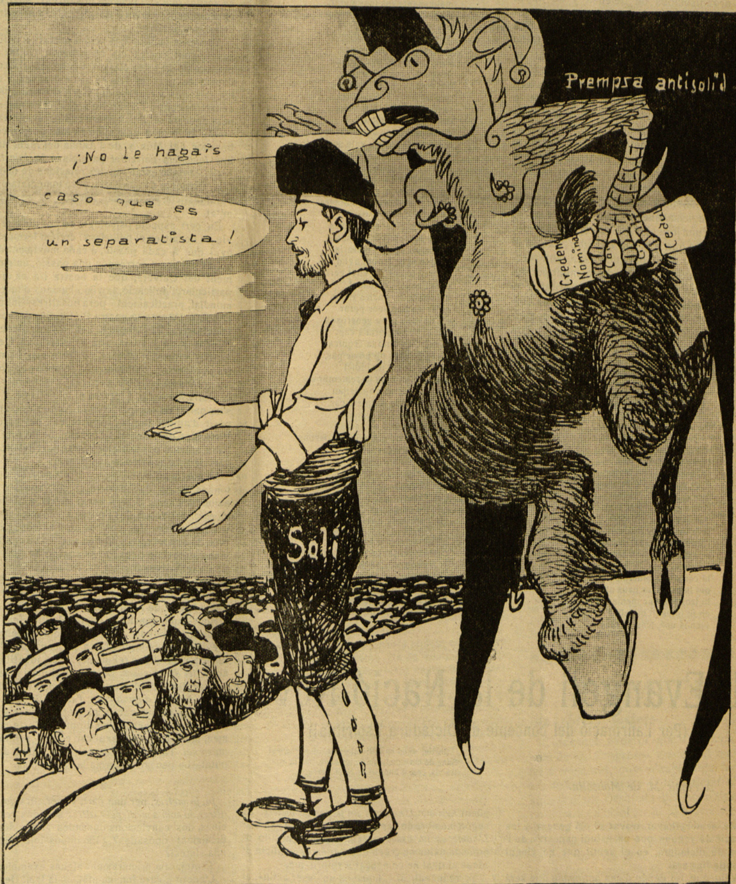
Catalunya: Germans de la Iberia, seguiu lo meu exemple. Desvetlleuse, y tots junts acabarem ab la tirania que'ns endogala. El monstre antisolidari: No l'escolteu á Catalunya, que va contra Espanya... vull dir contra la nostra menjadora.

Parodia del quadro Detrás la cruz... el diablo