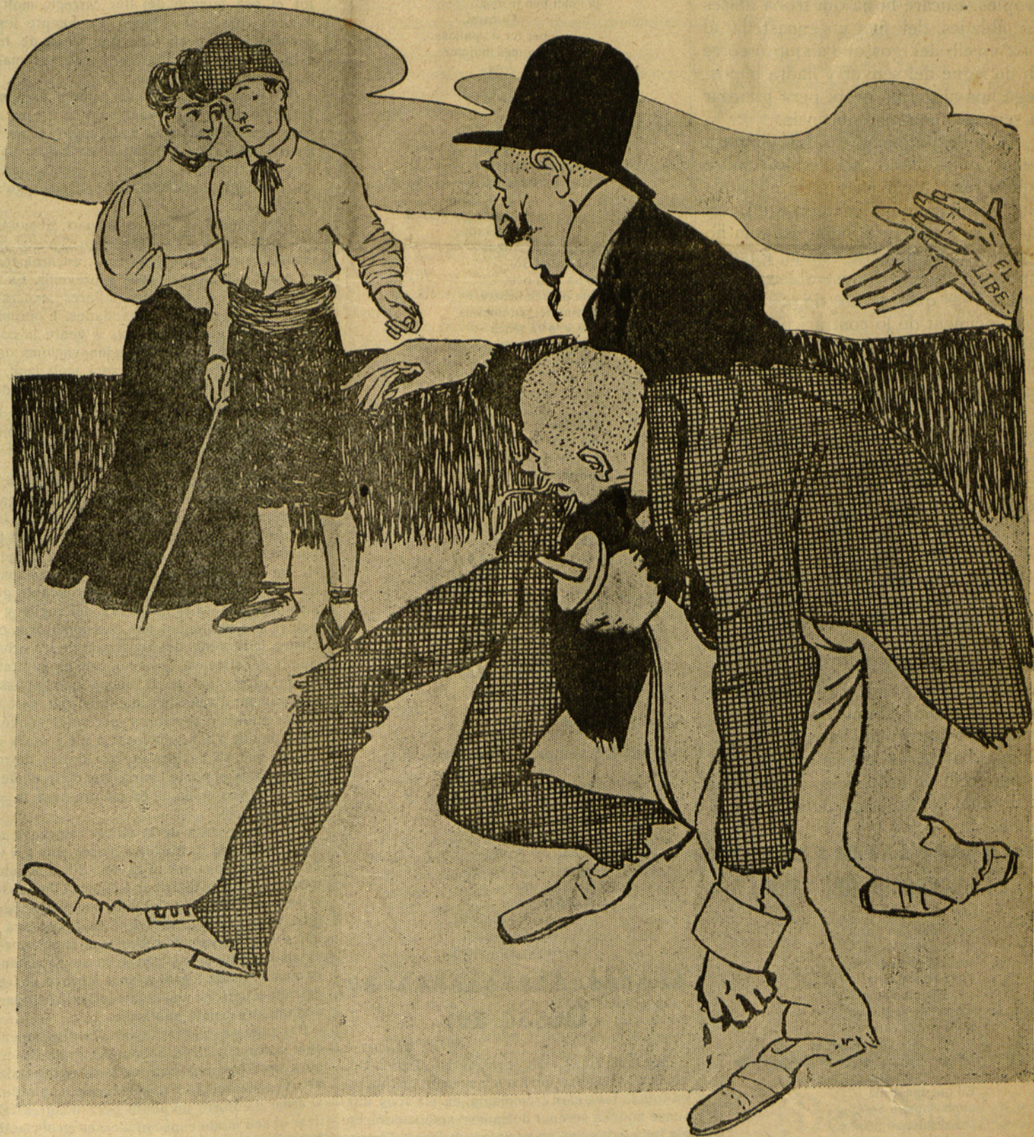
Els autors de "Era catalana,,

Ella: —Mira á n'aquells dos subjectes; escolta com insultan l'honra de tota Catalunya. Ell: —No'n fassis cas joh dona volguda! ¿No ho veus qu'están torrats?