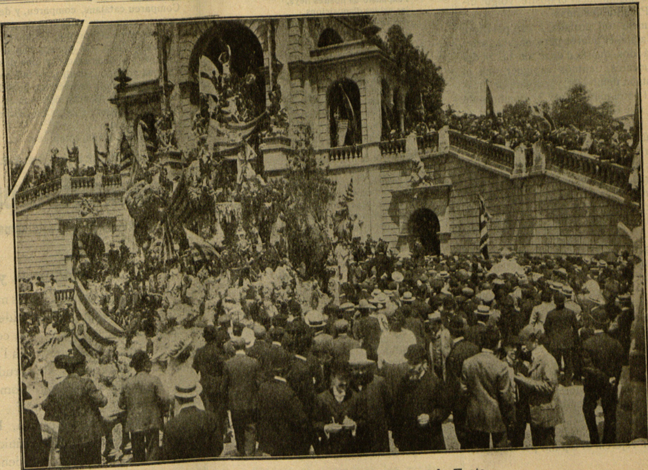
Aspecte de la cascada del park durant la Festa

Mentrestant els acorts ayrosos de la nostra