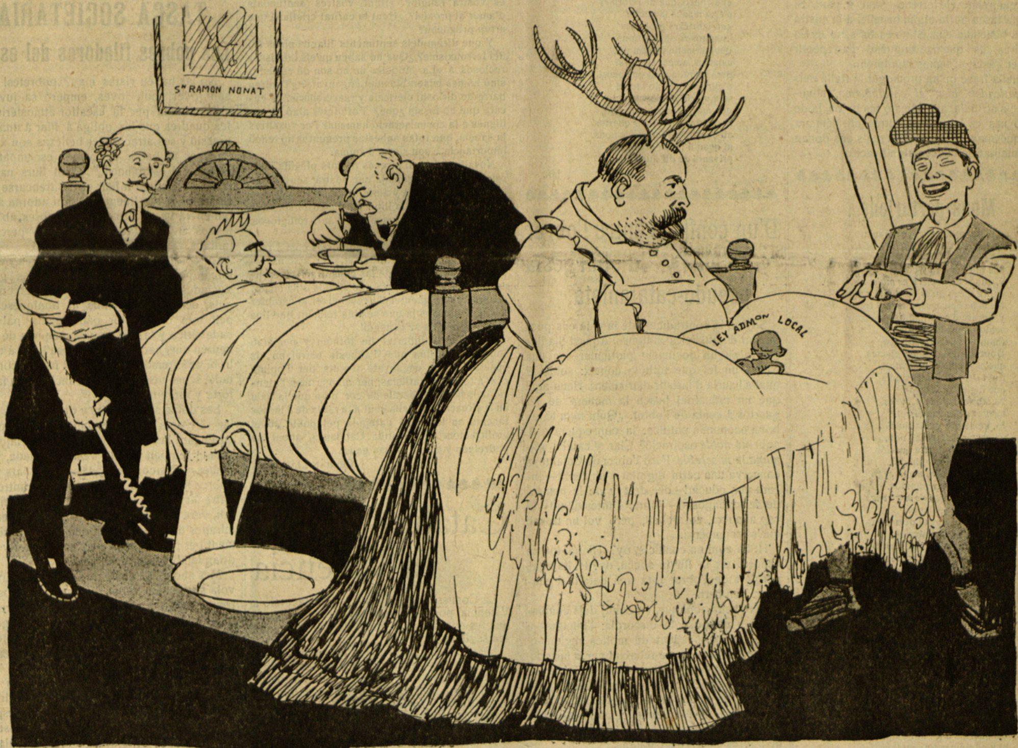
El Metrallayre: Y per parir aixó, l'ha incubat tres anys el seu president? Désil, home, désil, que no fa per casa, es massa raquílich.